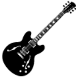
Guitar 1 L