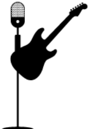
Guitar 2 R